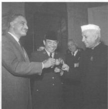
عبد الناصر مع نهرو وسوكارتو